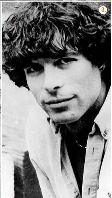
1. Combate de Negro e de Cães 2. Ensaio de O Retorno ao Deserto 3. Koltès: carreira curta e meteórica